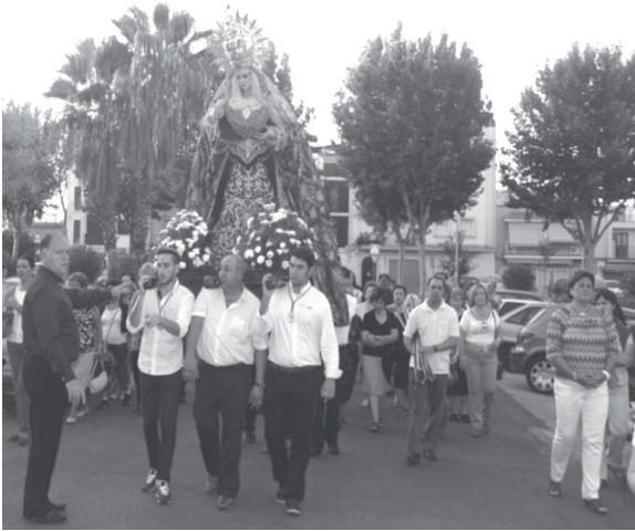
Entrada al Templo, Rosario de la Aurora 2013